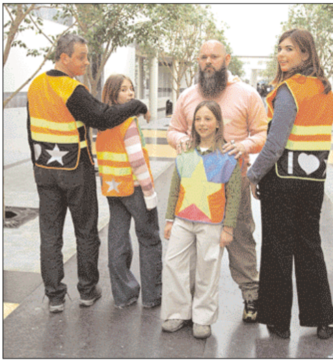
Modekoning Walter Van Beirendonck tussen enkele veiligheidsheesjes. "Ik wilde iets doen met sterren, omdat die 's nachts zichtbaar zijn. Vandaar 'I love stars' op de achterkant."