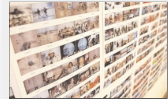
Veel oorlogen, veel foto's.

HASSELL - Toen iets meer dan een jaar geleden de oorlogsdreiging opnieuw erg voelbaar werd, vonden fotografen en kunstenaars Wolfgang Zurborn en Tina Schelhorn van de Duitse Galerie Lichtblick dat ze iets moesten doen. Het resultaat was de website www.imagesagainstar.com . Fotografen over de hele wereld stuurden hun 'oorlogsfoto's' binnen als statement tegen de oorlog in Irak. Ondertussen kwam de expo ook tot leven in tal van tentoonstellingsruimtes. Momenteel is Hasselt aan de beurt. Tot 24 april kan je de expo op zes plaatsen bezoeken. Een divers parcours langs een pak leed, maar gelukkig ook hoop.